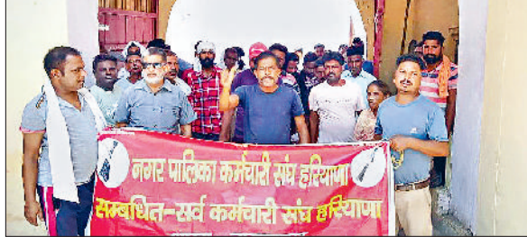
नगरपालिका कार्यालय के समक्ष धरना प्रदर्शन करते सफाई कर्मों।

वीरवार को नगरपालिका कर्मचारी संघ व डोर टू डोर सफाई कर्मचारी यूनियन के कार्यकर्ताओं ने नगर पालिका कार्यालय पर मांगों को लेकर प्रदर्शन किया। घरों से कूड़ा