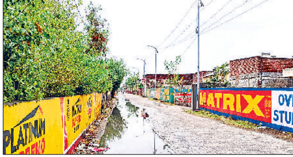
कुरुक्षेत्र। सुबह आसमान में छाए बादल व निकासी न होने के कारण सेक्टर 17 मार्केट में खड़ा बरसात का पानी।