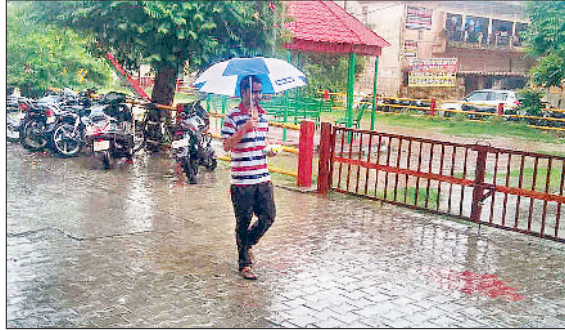
यमुनानगर में वीरवार सुबह हुई बारिश में भीगते हुए अपने गंतय पर जाते लोग।

वहीं, किसानों ने बारिश को ध्यान व गन्ने की फसल के लिए लाभदायक बताया है। वीरवार सुबह सात बजे के करीब रादौर क्षेत्र समेत जिले के कई हिस्सों में झमाझम बारिश होने लगी। इस दौरान बारिश के साथ मंद मंद हवा चलने से मौसम सुहावना बन गया। बच्चे और युवाओं ने बारिश में भीगकर खूब आनंद लिया। वहीं,