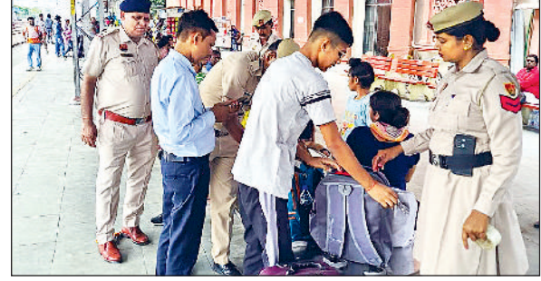
कुरुक्षेत्र। तलाशी अभियान चलाते जीआरपी कर्मी।