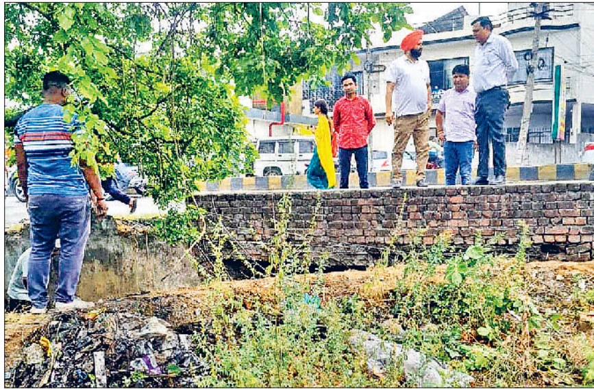
यमुनानगर। नालों की सफाई का जायजा लेते उप निगम आयुक्त डॉ.विजय पाल यादव व अन्य।

नगर निगम द्वारा करवाई जा रही नालों की सफाई के कार्यों का वीरवार को नगर निगम उप निगम आयुक्त डॉ.विजय पाल यादव ने निरीक्षण किया। उन्होंने नालों की सफाई की बारीकी से जांच की। साथ ही सफाई कार्य में जुटे सभी कर्मियों को नालों की अच्छी ढंग से सफाई करने, पूरी गाद को निकालकर उसका समय पर उठान कराने के निर्देश दिए। गौरतलब है कि नगर निगम क्षेत्र में लगभग 84 किलोमीटर माध्यम व बड़े नालों की सफाई का कार्य किया जा रहा है। निगमायुक्त आयुष सिन्हा के निर्देशों पर नालों की सफाई के लिए निगम द्वारा लगभग 64.53 लाख रुपये का टेंडर अलॉट किया गया था। कुछ दिन पहले वर्क ऑर्डर होने के बाद नालों की सफाई का कार्य शुरू किया गया। पूरे नगर निगम एरिया को दो जोन में बांटकर